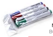
(SETFIXWB) MARKER PENS BOARDMARKER