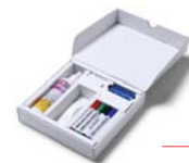
(STARTERKIT) STARTERKIT STARTPACKUNG